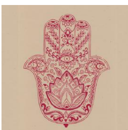
T-9 Hamsa gross