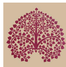
T-10 Bodhi Tree